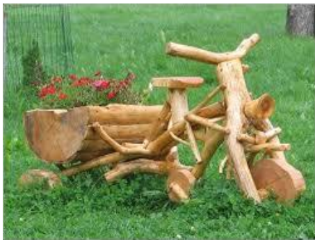
«Клумба для мамы»