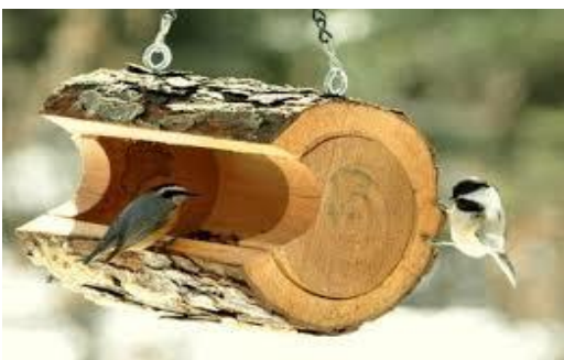
«Кормушка для птиц»

Креативная помощь населения городским службам по ликвидации завалов упавших тополей