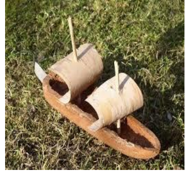
«Куколки девочкам и кораблики мальчикам»