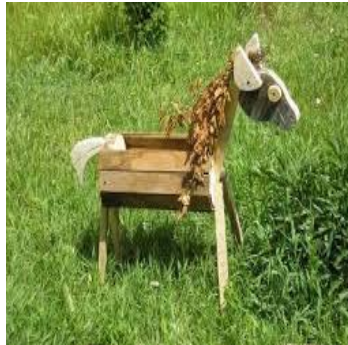
«Конь для папы и подружка для меня»