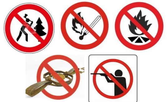
Карточки для проведения игры