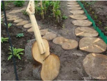
«В сад дорожка бабушке»