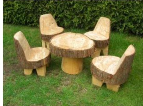
«Стул и стол для дедушки»