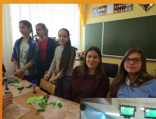
Мастер-классы и дружественные встречи с воспитанниками детского дома №6 г. Хабаровска