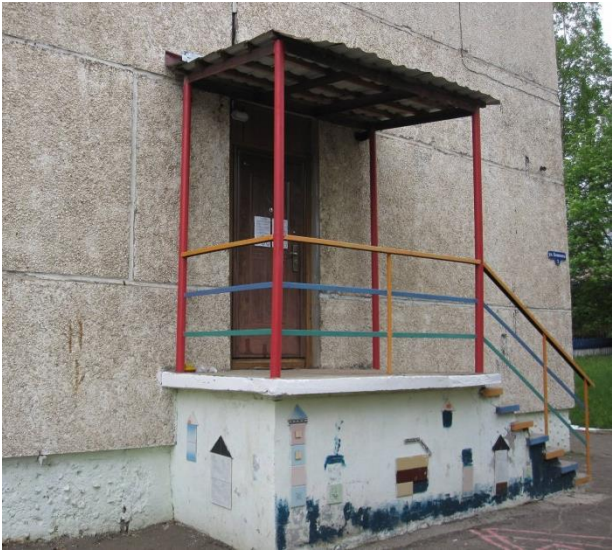
ТАК ВЫГЛЯДЕЛО КРЫЛЬЦО МБДОУ № 6