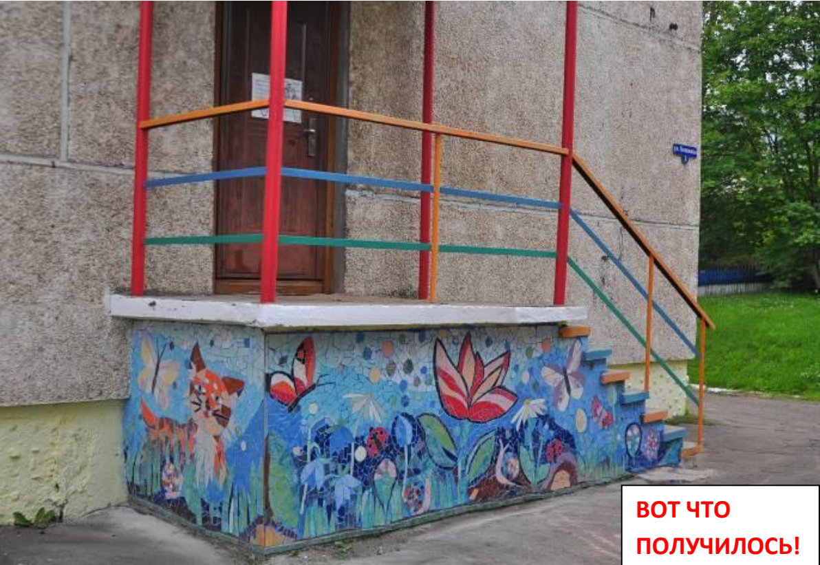
ВОТ ЧТО ПОЛУЧИЛОСЬ!