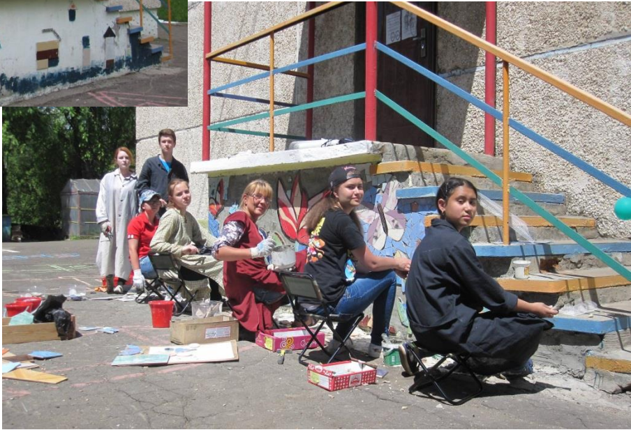
МЫ ДРУЖНО ВЗЯЛИСЬ ЗА ДЕЛО