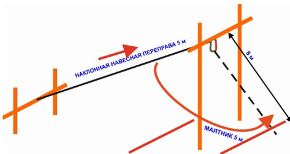
Схема блока этапов – схематичное изображение, на котором указаны параметры блока этапа (направление движения по блоку этапов, расположение рабочих зон, контрольных линий, горизонтальных и вертикальных опор). Схема каждого блока этапов обязательно прилагается к Условиям. Для выполнения схем блоков можно использовать программы Paint, Word, CorelDraw.

В графе «Финиш» указывается, каким образом будет осуществляться финиш участников (группы, связки). В нашем случае это финиш с отметкой в финишной станции системы электронной отметки.