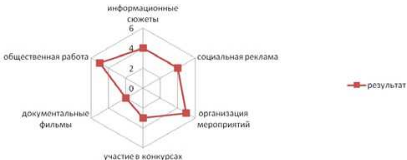
Рис. 2. Графическая схема результатов индивидуального образовательного маршрута подростка с признаками одаренности Детской студии телевидения «Хабаровск»

На начальном этапе педагог совместно с ребенком определяет интересные учащегося направления деятельности (информационные сюжеты, социальная реклама, организация мероприятий студии, участие в конкурсе, документальные фильмы, общественная работа). На схему наносятся направления деятельности и планируемое время и качество приложенных усилий учащегося для их реализации. Подросток или ребенок сам определяет, сколько времени и сил он готов потратить на реализацию этого направления своей деятельности. Такой план составляется до половины учебного года. Потом совместно с педагогом составляется графическая схема промежуточных результатов (рис. 2).