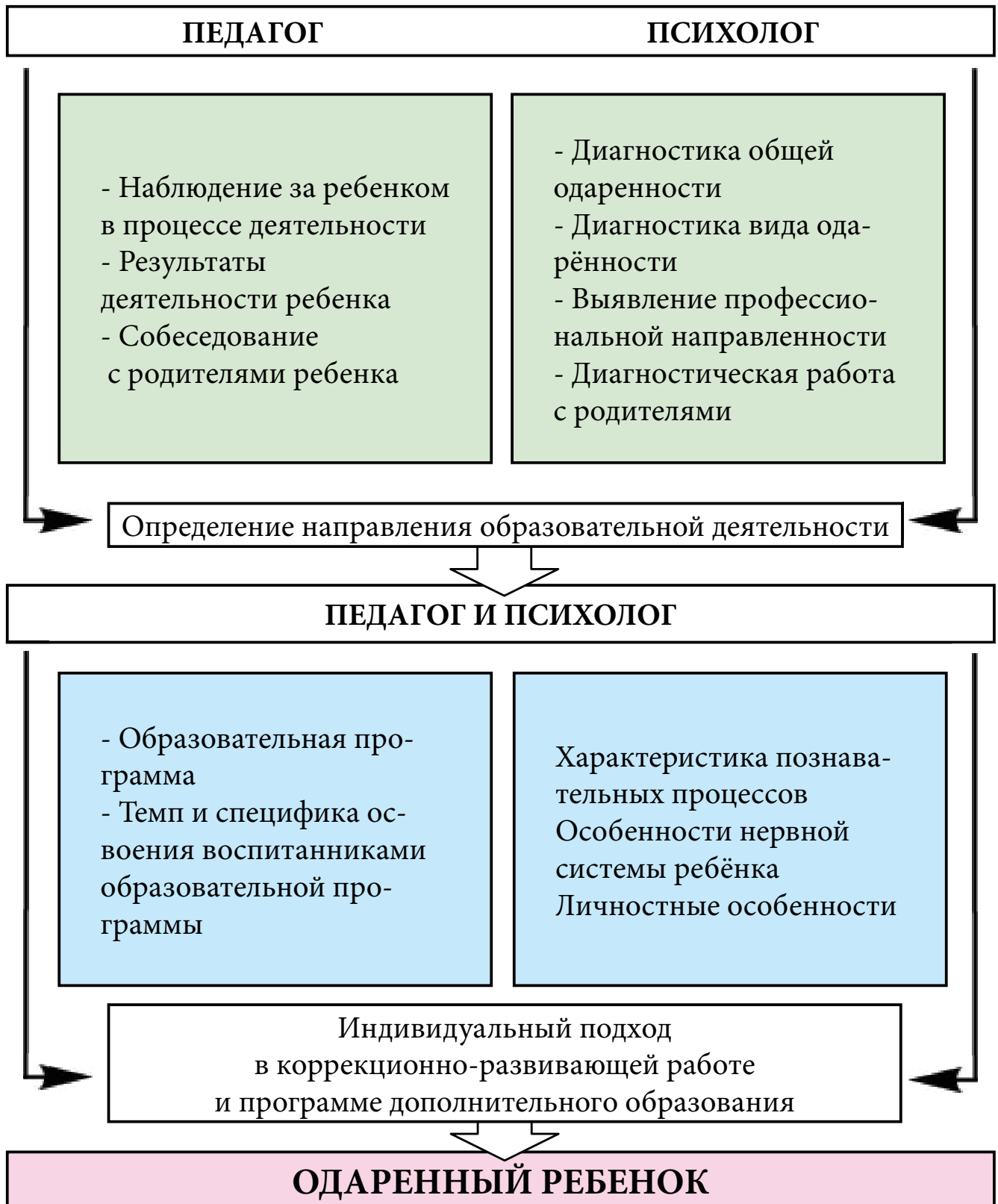
Схема взаимодействия педагога дополнительного образования и психолога при составлении индивидуальной образовательной программы