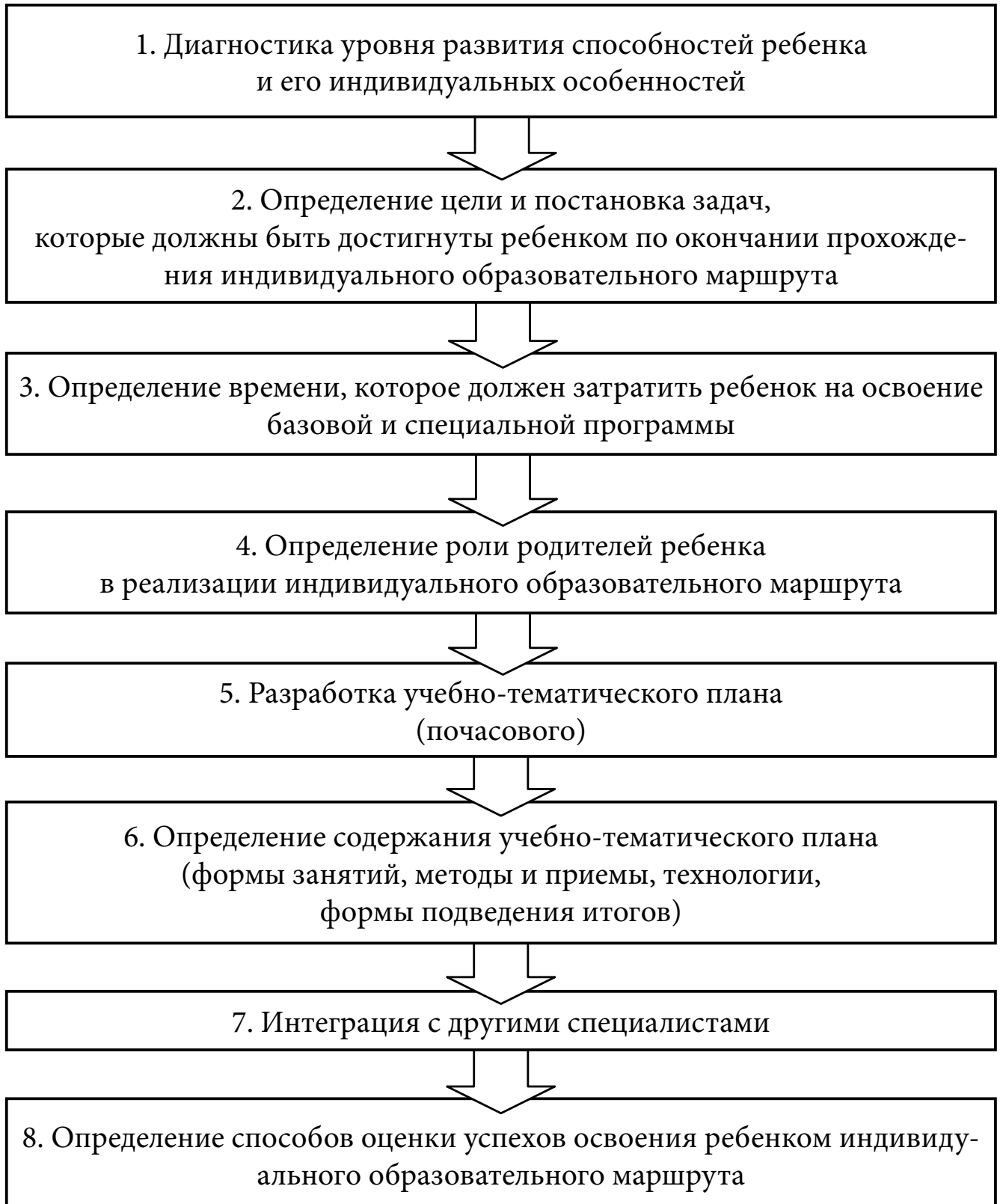
Схема разработки индивидуального образовательного маршрута